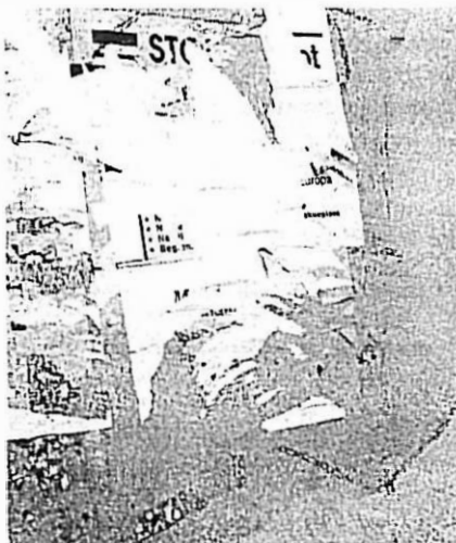
Oppklisting/fjerning av plakater gir malingskader

lingspåføringen at en tilfredsstillende inntrengning ikke ble oppnådd. Ved uttørring av veggen etter maling, har salter krystallisert dels på malingens overflate, dels i ytre pussjikt (foto 2). En var, allerede før det ble malt, klar over at problemer av denne art kunne oppstå. Den tørketiden som her ville vært nødvendig, var det i praksis ikke mulig å legge inn i fremdriften.